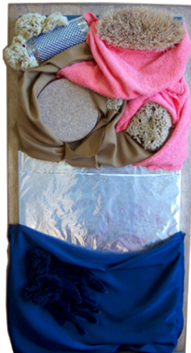
Tabla “Sudán – París”