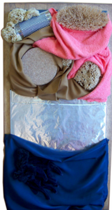
Tavola “Sudan – Parigi”